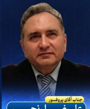
جناب آقای پروفسور